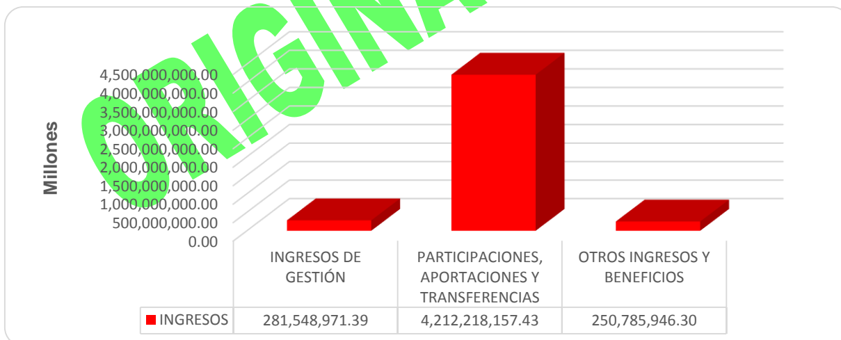
GRÁFICA 1 INGRESOS